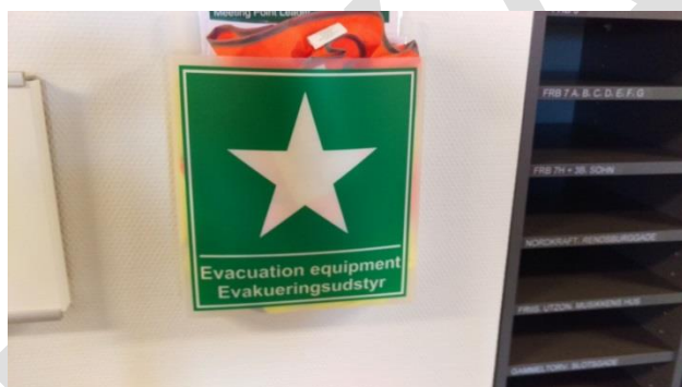
Foto 2. Væghængt evakueringsudstyr.

I alle AAU's bygninger er der – ofte flere steder i bygningerne – ophængt evakueringsudstyr. Evakueringsudstyret understøtter en evakueringsopgave i bygningen eller i dele af bygningen.